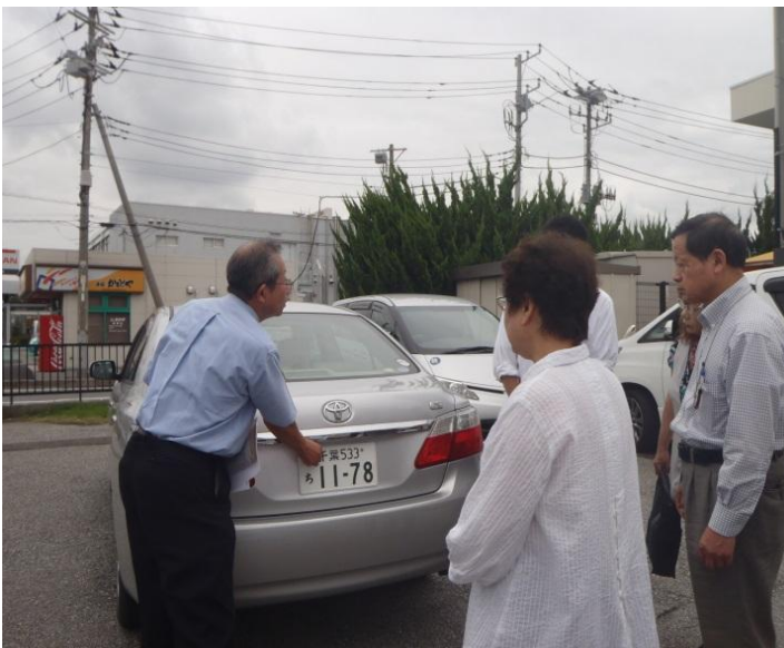
写真 ナンバー取付・封印

※出張封印は、各ナンバーセンターと契約している行政書士が行うことができる制度です。